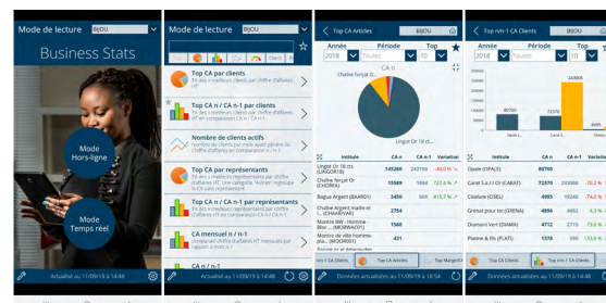
Consultation en temps réel ou en mode Hors Ligne de vos statistiques de vente clients et articles.

Consultation/modification des informations clients et contacts, consultation des documents de vente, ajout de photos à un document ou à un client, validation de devis par signature électronique, utilisation de l'intelligence artificielle pour créer un contact ou un prospect depuis une carte de visite.